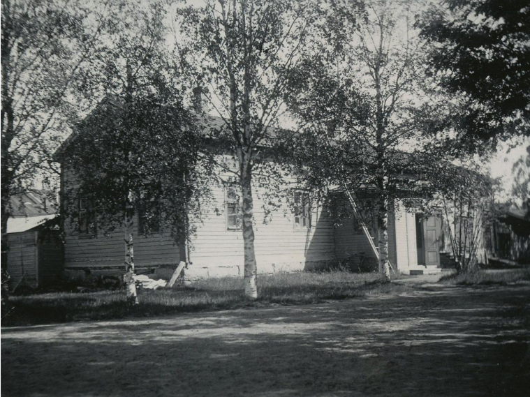
Tullinhoitaja Brunowin perikunnalta ostetun empiretalon piharakennus toimi Raahen poliisien toimipaikkana sen jälkeen kun Isotorin tontti myytiin. Vasta vuonna 1974 siirryttiin vastavalmistuneeseen Valtion Virastotaloon.

poliisitupakin sijaitsi, jotenka vahtihuone jouduttiin siirtämään. Tullimies Brunowilta oli ostettu 1862 komea Rantakadun varrella sijaitseva kivitalonsa kaupungin raatihuoneeksi ja tällä tontilla sijaitsevaan puurakennukseen siirtyi kaupunginvankila. Rakennuksessa oli kaksi vankikoppia ja vahtikonttori, ilmeisesti viskaalin oma konttori sijaitsi raatihuoneella.