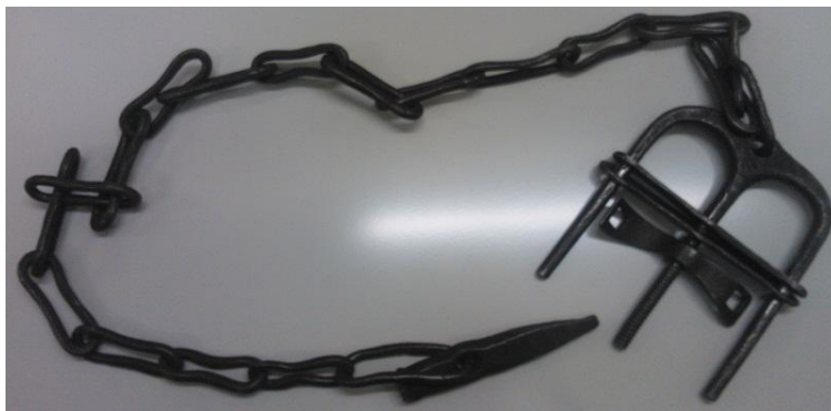
Kiilan ja ketjun avulla seinään kiinnitettävät käsiraudat.

Kistun päämiehenä toimi viskaali, jonka alaisuudessa yövartija ja patrulli toimivat. Kistussa säilytettiin hirmuisia vankeihin vehkeitä: hanskluvia, kaularautoja, kaffelirautoja ja kankipultteja. Ja poliisitalon pihapiirissä pönötti karmea kaakinpuu, tuo tuhmelusten kauhu. Aika ajoin pani viskaali toimeen kunnan pieksäjäiset, niin että piestävän ulvonta kuului kauas aidan ulkopuolelle. Eipä silti, raahelaiset kyllä tunkivat sisäpuolellekin vallan katselemaan kun joku pahantekijä oli kaakinpuussa piestävänä.